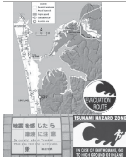
Fig. 6. Mapa de peligrosidad de tsunamis en la isla de Westport junto con señales indicativas de zona de peligro de tsunami y ruta de evacuación.

Los tsunamis de origen local son los más peligrosos, la primera ola puede llegar entre 10 a 30 minutos de haberse producido el sismo. Estos datos son básicos para planificar la evacuación, porque es el tiempo que se tiene para evacuar a la población de la zona inundable.