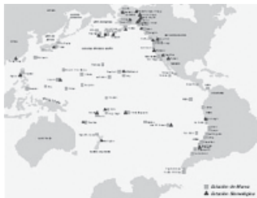
Fig. 2. Estaciones sismológicas y de marea del sistema de Alarma de Tsunami del Pacífico.

vidad sísmica y el nivel de la superficie del océano en la Cuenca del Pacífico (fig 2).