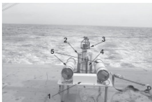
Fig. 4. Dispositivo de detección de Tsunamis. 1: BPR; 2: Módem acústico; 3: Emisor acústico; 4: CPU; 5: Baterías.

segundos se activa un protocolo de aviso emitiendo la señal a la boya de superficie. El dispositivo tiene además un ancla que evita que se desplace por el fondo marino, un módem acústico que transforma la señal del sensor en una onda acústica, un emisor acústico que emite la señal del BPR, una CPU de titanio que contiene todas las piezas eléctricas que regulan el manómetro y el módem y una batería que alimenta los dispositivos electrónicos de la CPU, el transductor y el sensor.