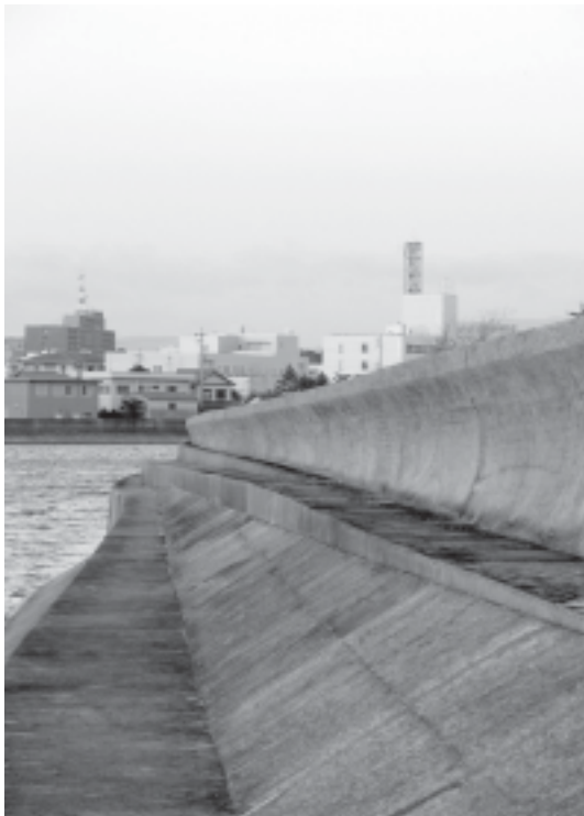
Fig. 5. Tipo de rompeola diseñado en Tsu-Shi (Japón) como defensa contra tsunamis.

Es imposible proteger completamente cualquier costa del impacto de los tsunamis. Algunos países han construido rompeolas, diques y varias otras estructuras para tratar de debilitar la fuerza de los tsunamis y para reducir su altura. En Japón, los ingenieros han construido enormes terraplenes para proteger los puertos y rompeolas para angostar las bocas de las bahías en un esfuerzo para desviar o reducir la energía de las poderosas olas (fig. 5).