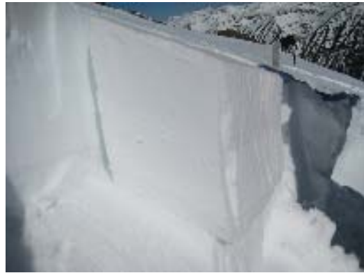
Figura 2: Diagrama de les mides del bloc a aïllar en l'ECT (modificat de Simenhois & Birkeland 2006) i fotografia d'un ECT positiu aquest hivern al Pirineu.