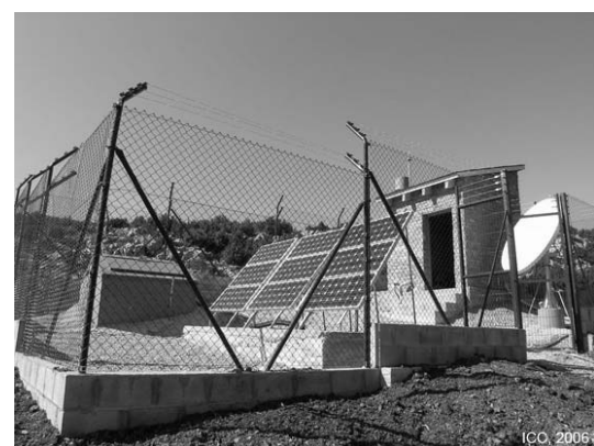
Figura 2 – Estación sísmica de campo de la red VSAT (Seismic station of VSAT network)