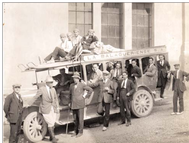
Peça del fons fotogràfic.