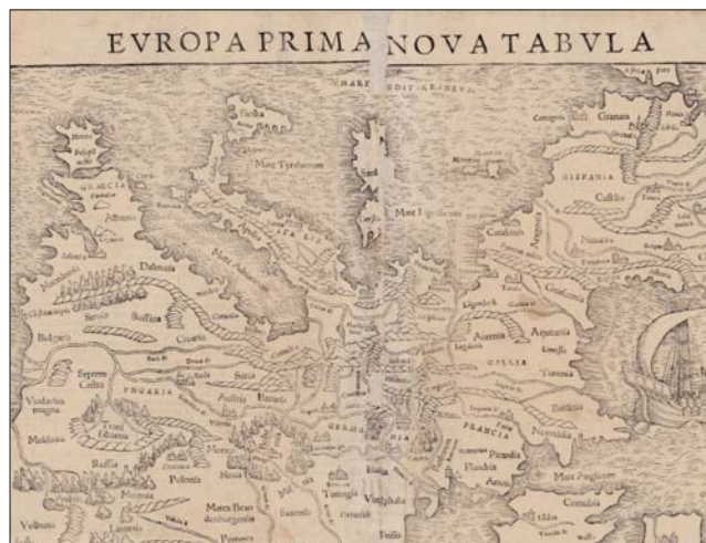
Peça del fons cartogràfic.