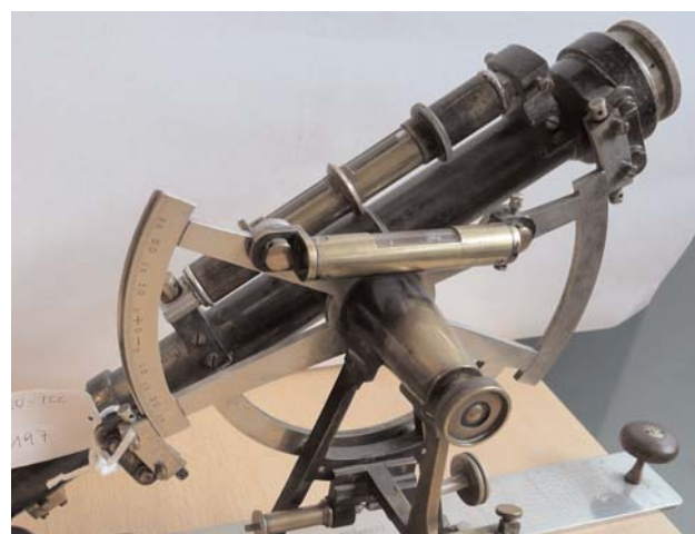
Instrument que forma part del museu de la CTC.

La biblioteca i una part del fons cartogràfic també estan integrats al Catàleg Col·lectiu de les Universitats Catalanes (CCUC) que permet un millor accés a la informació de les institucions consorciades, estalvi de recursos de catalogació i estandardització de pautes bàsiques de catalogació.