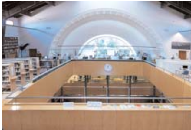
Sala de consulta de la CTC.