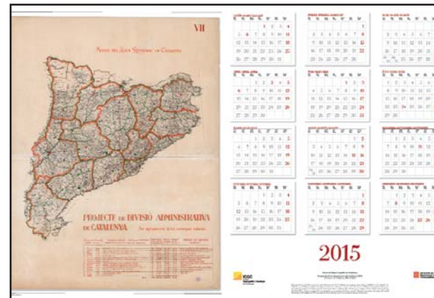
Làmina del calendari 2015.

Parc de Montjuïc – 08038 Barcelona Telèfon: (34) 93 567 15 00 – Telefax: (34) 93 567 15 67