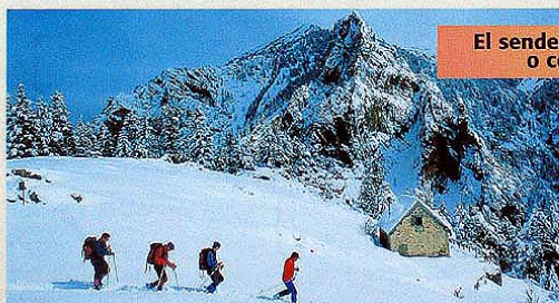
El senderismo con esquís o con raquetas