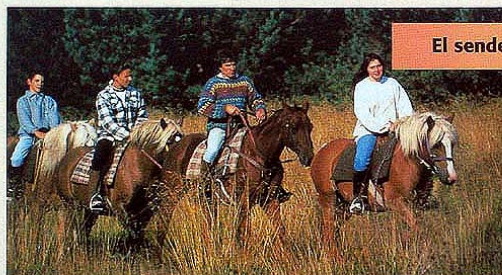
El senderismo a caballo