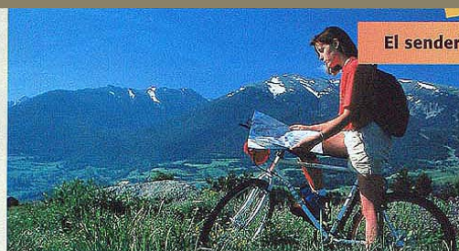
El senderismo en bicicleta