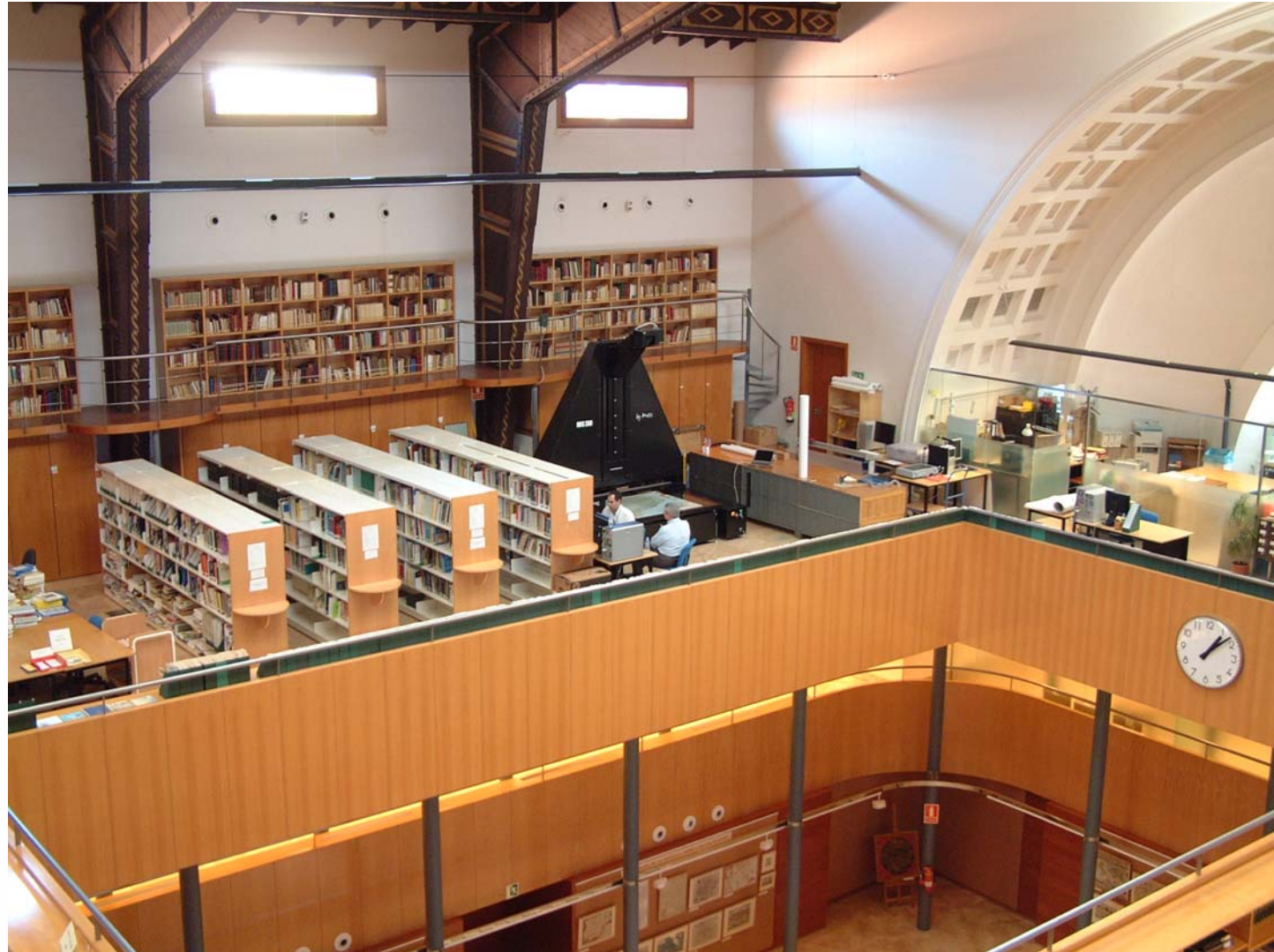
1a reunió d'usuaris de ContentDM a Espanya. 30 d'octubre de 2007