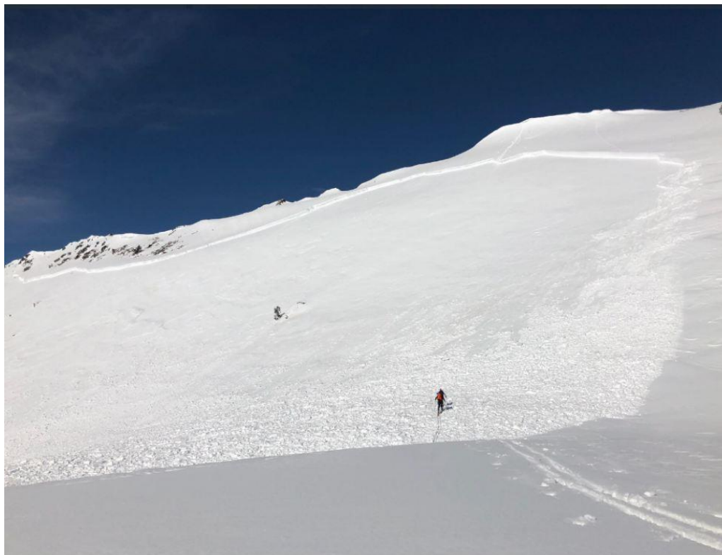
Imatge de l'allau al Tuc de Saumet (Aran-Franja Nord de la Pallaresa), esdevingut el dia 15 de febrer. La cicatriu té un gruix entre 60 i 100 cm, i una amplada de gairebé 500 m, fet que il·lustra la bona propagació de la capa de facetes per la qual s'ha trencat.