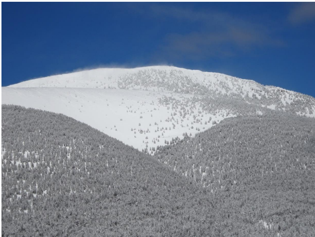
Imatge de la Serra del Port del Comte del dia 12 d'abril de 2018. Després del recent episodi de nevades la innivació és molt elevada; es pot apreciar lleu transport de neu a les zones més exposades degut al vent de nord.