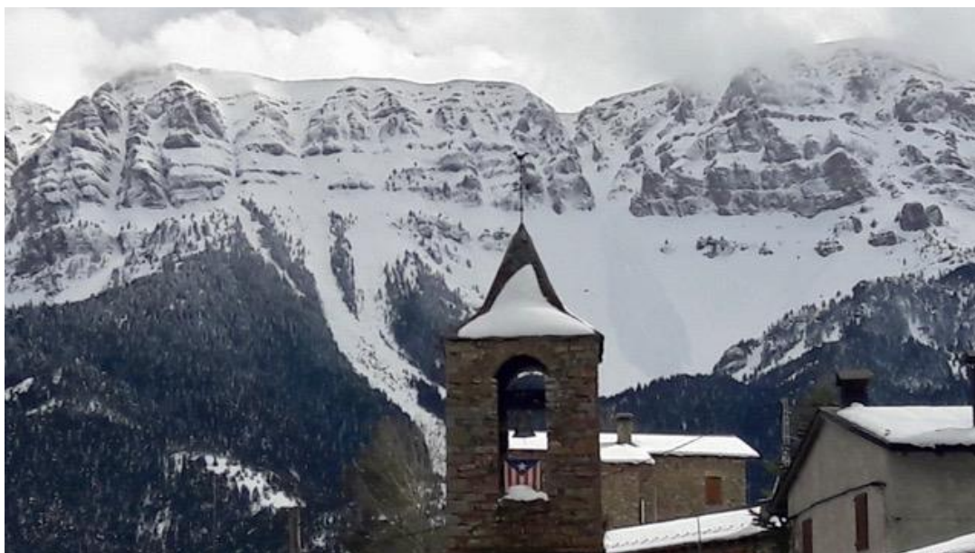
Imatge del Vessant nord del Cadí del dia 16 d'abril de 2018 des d'Estana. Una allau de mida 2 ha involucrat la neu de l'últim episodi a la Canal de Llitze.