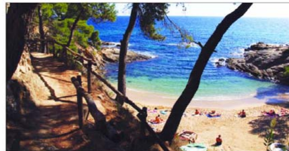
Küstenwanderweg „Cami de Ronda“

Es bestehen Busverbindungen nach Girona und Barcelona. Auf Wunsch können Sie noch in den beiden Städten Verlängerungstage buchen.