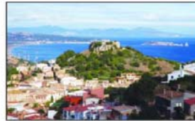
Blick auf Begur

Die Costa Brava ist den meisten für ihre schönen Strände bekannt. Dabei eignen sich auch besonders die zerklüfteten Abschnitte der Küste im Frühjahr und Herbst hervorragend zum Wandern.